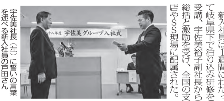
38人が「新戦力」として

宇佐美グループ入社式 全国に450カ所あるSSを運営する宇佐美グループの新社員が、入社式を行った。今年度の新社員は、入社式を行った。今年度の新社員は、入社式を行った。