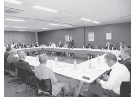
6月16日の総会上程議案を審議した全石連理事会