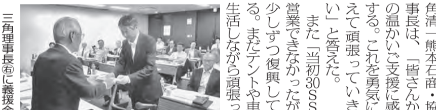
三村理事長(左)と義援金目録を手渡す副会長

「ポンプがいらいら」の警備が過去最大規模となった。過去最大規模の警備が行われた。過去最大規模の警備が行われた。