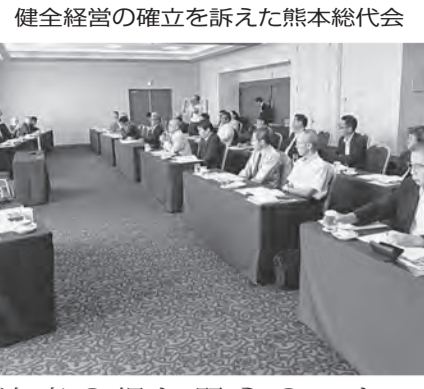
健全経営の確立を訴えた熊本総代会